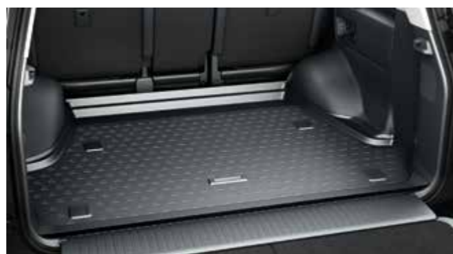
Гумовий килимок багажного відділення

Вся інформація, представлена у цьому буклеті, є точною та дійсною станом на дату публікації: 10.09.2019. Виробник та імпортер залишають за собою право без попереднього повідомлення вносити зміни в будь-які технічні характеристики і комплектацію автомобілів під час їх адаптації до місцевих умов експлуатації, а також у процесі вдосконалення моделей. Зовнішній вигляд автомобіля та його складових може відрізнятися від зображених у цьому буклеті. Жодну частину цього матеріалу не може бути відтворено у будь-який спосіб без попереднього письмового дозволу правласника. Зазначені в цьому матеріалі назви комплектаций є суто умовними та використовуються виключно заради зручності в розподілі наборів параметрів автомобіля. Такі назви можуть відрізнятися або бути відсутніми в інших документах або матеріалах, які стосуються автомобіля, що жодним чином не впливає на повноту, точність чи достовірність поданої інформації.