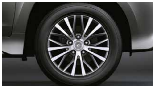
Легкосплавні диски 20", сріблясті