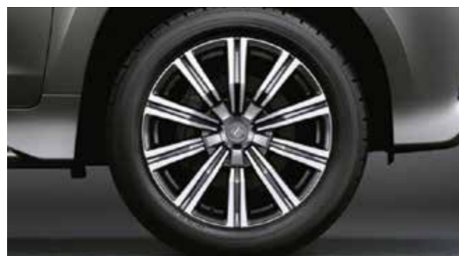
Легкосплавні диски 21", сріблясті