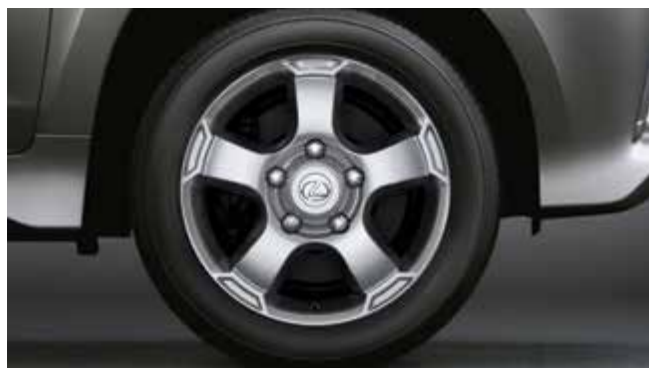
Легкосплавні диски 18", сріблясті