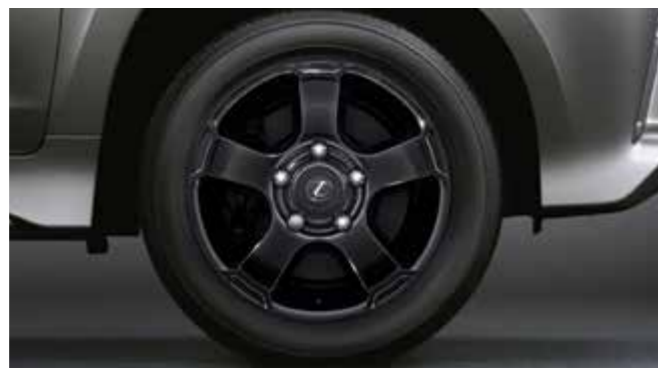
Легкосплавні диски 18", чорні