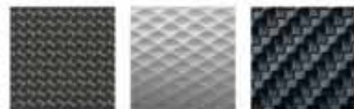
Silver, metal film Naguri-Style Aluminium Carbon Fibre, set of inlays