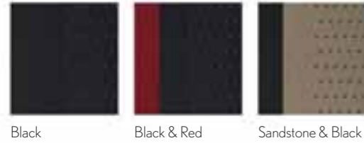
Black Black & Red Sandstone & Black