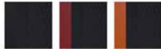
Black Black & Flare Red Black & Orange