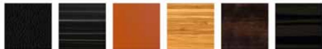
Storm Black Techno Black Orange Bamboo Dark Brown, Ash Burl Black & Grey, Shimamoku