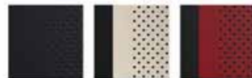
Black White & Black Flare Red & Black