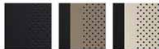
Black Sandstone & Black White & Black