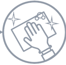
Fehértőmentes fertőtlenítő kendő