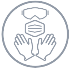
Védőszemüveg, maszk, kesztyű